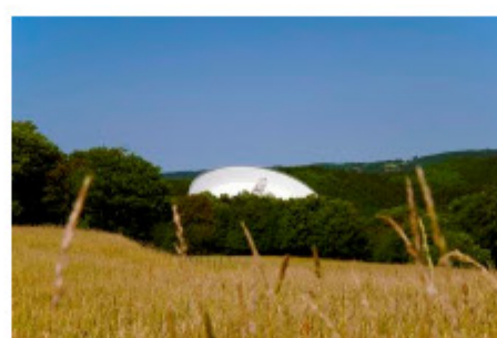
6. Gerd Fingerhuth