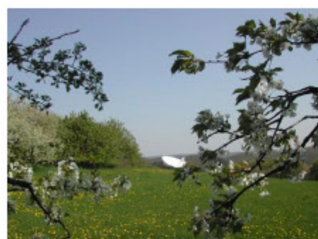
5. Reinhard Simmteit