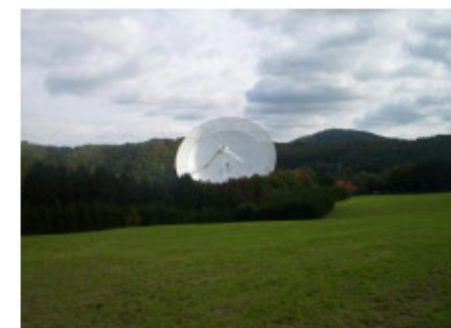
10. Abdyl Berisha

(Für höher aufgelöste Aufnahmen die Bilder anklicken!)