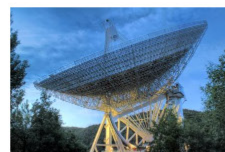
7. Marcus Schwabe